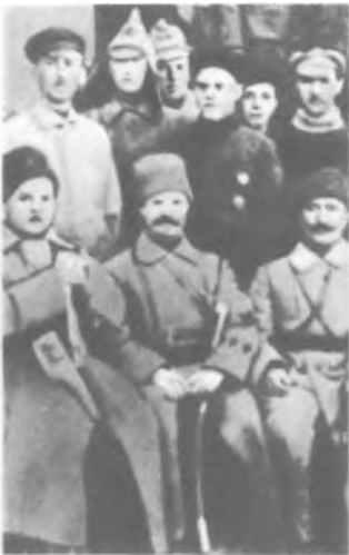
( ) 1920 .