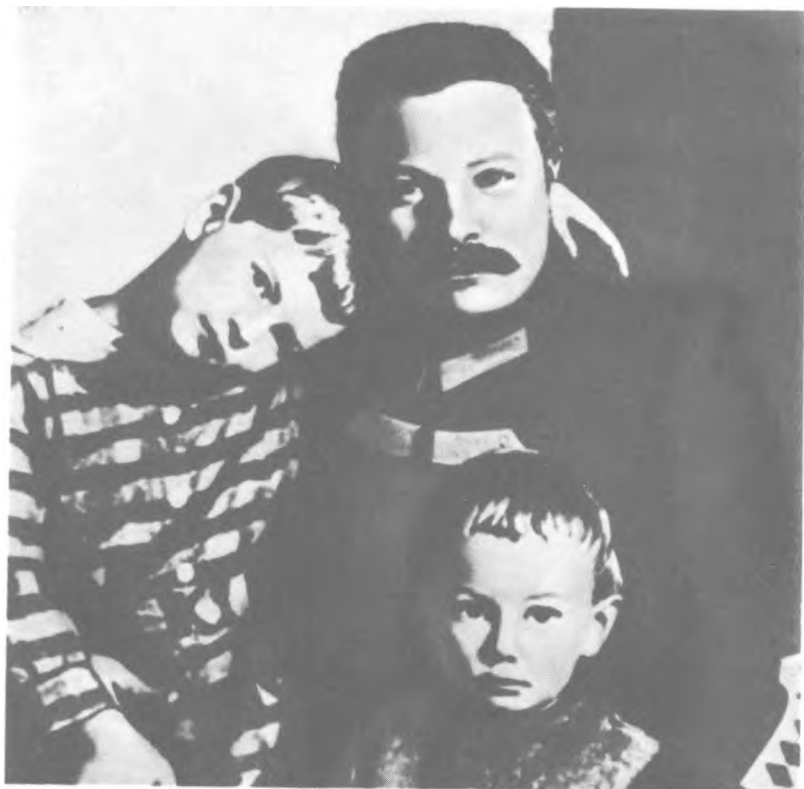
М. В. Фрунзе с детьми —