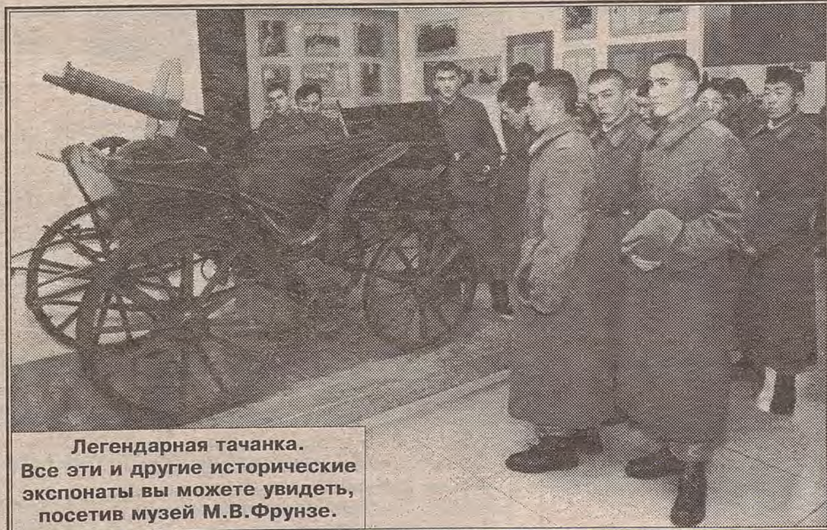
Легендарная тачанка. Все эти и другие исторические экспонаты вы можете увидеть, посетив музей М.В.Фрунзе.