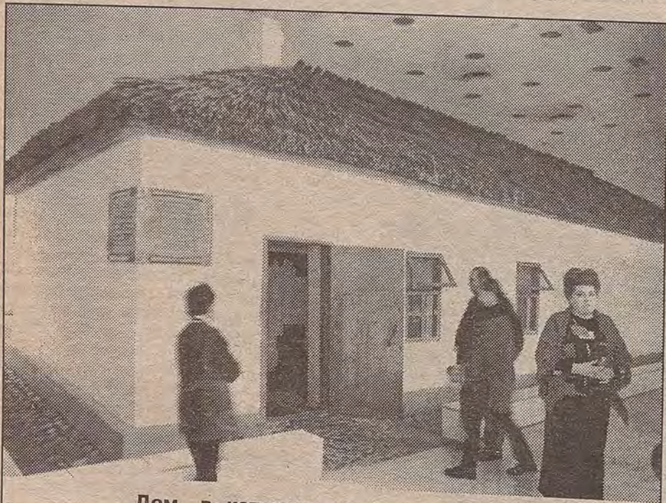
Дом, в котором родился М.В.Фрунзе. Сохранен историками в первозданном виде.

цев спустя - командующим 4-й армией Восточного фронта. Под его руководством была разбита 300-тысячная армия Колчака. За эту битву Фрунзе был