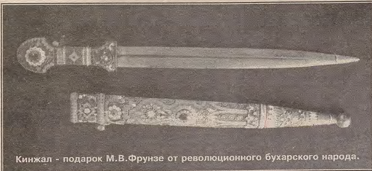
Кинжал - подарок М.В.Фрунзе от революционного бухарского народа.